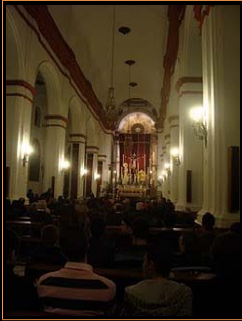
Momento en que el presidente de la Agrupación de Cofradías y Corporaciones Bíblicas de Puente Genil presentó el acto