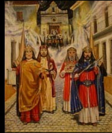
Viva La Coronación de Jehú